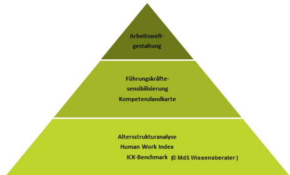
Abbildung: Generationenbalancemodell ©academy4socialskills, ICKModell© Mds Wissensberater

Selbstverantwortung, Veränderungsbereitschaft und Kreativität sind die Kernanforderungen an den Arbeitnehmer von morgen. Auf der anderen Seite: Arbeitsorganisation und HR-Management geschehen unter neuen Vorzeichen, denn in der „Creative Economy“ bleibt kein Stein auf dem alten.